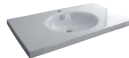
Lavabo suspendido 93 x 52 93 x 52 Wall hung basin Lavabo 93 x 52 suspendu 100090021 / N396990843

Instalación y mantenimiento Installation and maintenance Installation et maintien