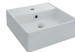
Lavabo suspendido 40 x 42 40 x 42 Wall hung basin Lavabo 40 x 42 suspendu 100090125 / N372769938

Instalación y mantenimiento Installation and maintenance Installation et maintien