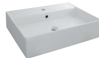
Lavabo suspendido 46 x 60 46 x 60 Wall hung basin Lavabo 46 x 60 suspendu 100090126 / N372769939

Instalación y mantenimiento Installation and maintenance Installation et maintien