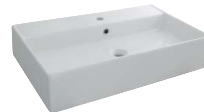
Lavabo suspendido 46 x 80 46 x 80 Wall hung basin Lavabo 46 x 80 suspendu 100090127 / N372769937

Instalación y mantenimiento Installation and maintenance Installation et maintien